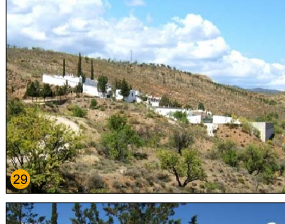
CEMENTERIO MUNICIPAL EQ-SO