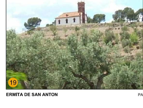
ERMITA DE SAN ANTON PA