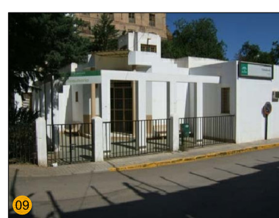
CONSULTORIO MEDICO EQ-AS