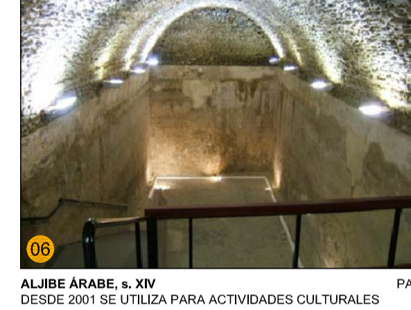
ALBIBE ÁRABE, s. XIV DESDE 2011 SE UTILIZA PARA ACTIVIDADES CULTURALES PA