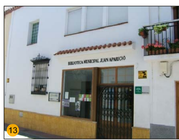
BIBLIOTECA MUNICIPAL JUAN APARICIO 3 PLANTAS DE 110 m² EQ-CU