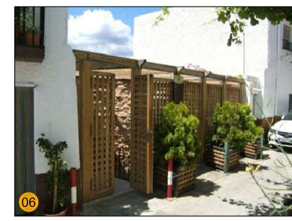
ERMITA DE SAN ANTON PA