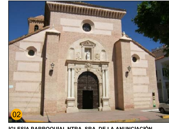
IGLESIA PARROQUIAL NTRA. SRA. DE LA ANUNCIACIÓN ESTE DE MUÑEJAR, SIGLO XVI EQ-SO / PA