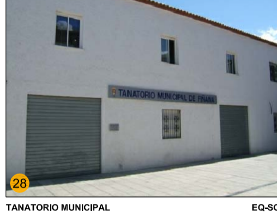
TANATORIO MUNICIPAL EQ-SO