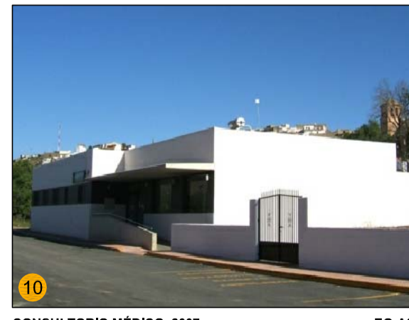
CONSULTORIO MEDICO, 2007 EQ-AS