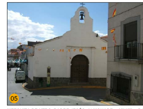
MEZQUITA DE NTRD. PADRE JESUS, ALMOHADE s. XIII-XIV PA