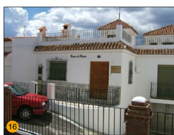
MUSEO DE FRIANA ABIERTO DESDE EL AÑO 2002. 9 SALAS DE EXPOSICIÓN SOBRE LA CULTURA Y EQ-CU