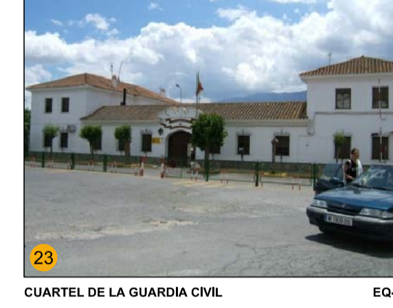
CUARTEL DE LA GUARDIA CIVIL EQ-GE