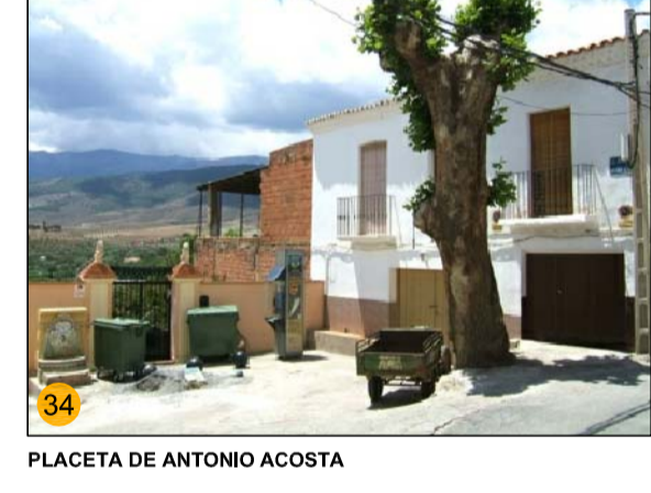
PLACETA DE ANTONIO ACOSTA PA