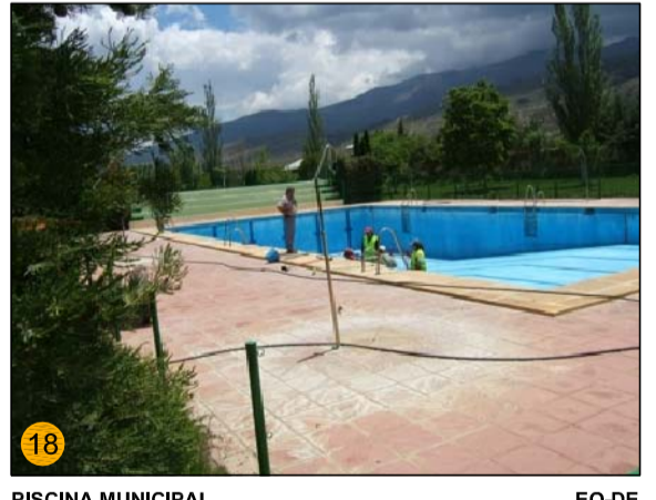
PISCINA MUNICIPAL EQ-DE