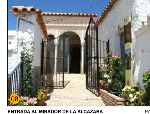
ENTRADA AL MIRADOR DE LA ALCAZABA PA