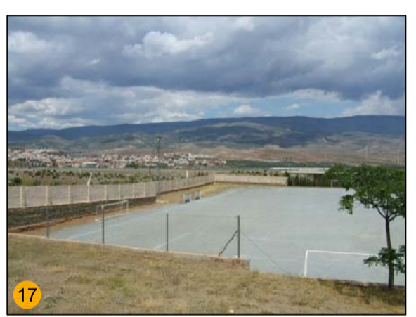
CAMPO DE FÚTBOL EQ-DE