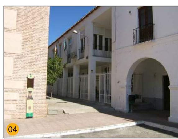
HOGAR DEL PENSIONISTA EQ-SO