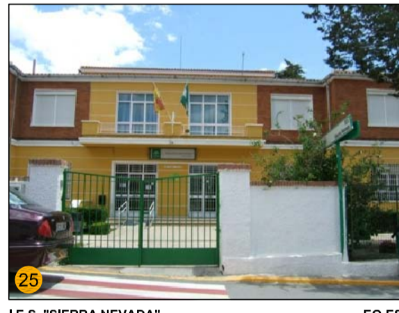
I.E. "SIERRA NEVADA" EQ-ES MATRICULADOS: 317 JÓVENES REPARTIDOS EN 13 GRUPOS