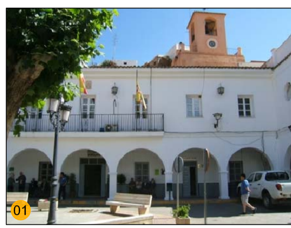
PLAZA CONSTITUCIÓN - AYUNTAMIENTO DE FRIANA EQ-SO PA