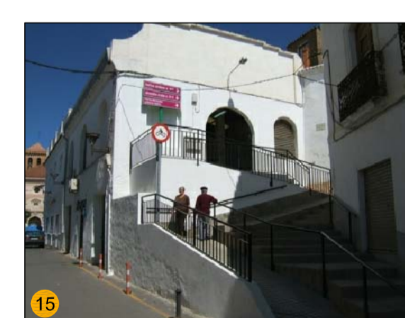
MERCADO MUNICIPAL DE ABASTOS PLANTA BAJA: 30 m², PLANTA ALTA: 230 m² EQ-CO