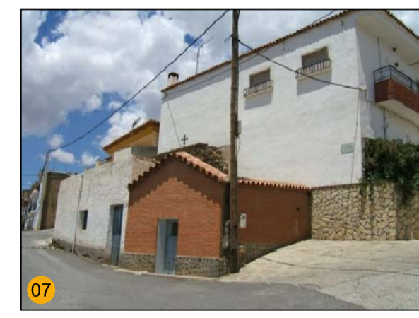
ERMITA DE LAS ANIMAS PA