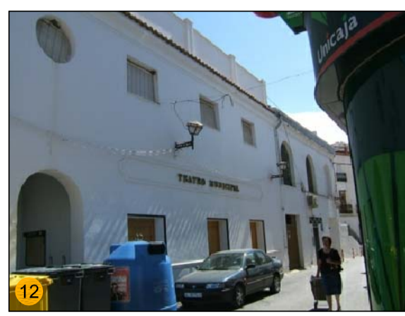
TEATRO MUNICIPAL AFORO PARA 200 ESPECTADORES EQ-CU