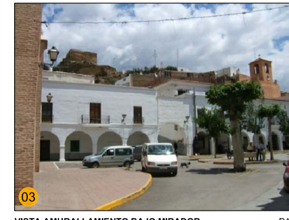
VISTA AMURALLAMIENTO BAJO MIRADOR HASTA TORRE VIGÍA PA