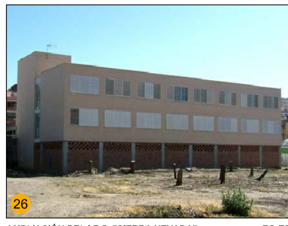
AMPLIACIÓN DEL I.E. "SIERRA NEVADA" EQ-ES