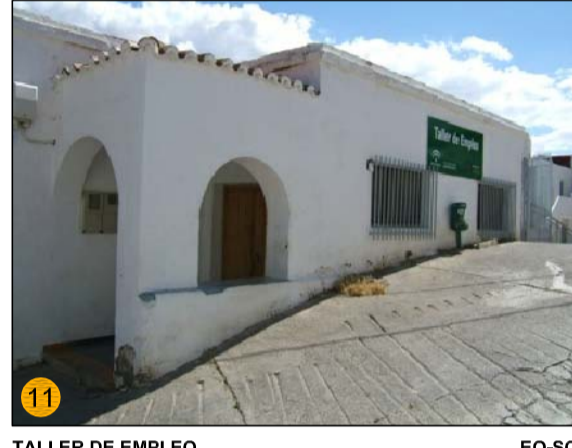
TALLER DE EMPLEO EQ-SO