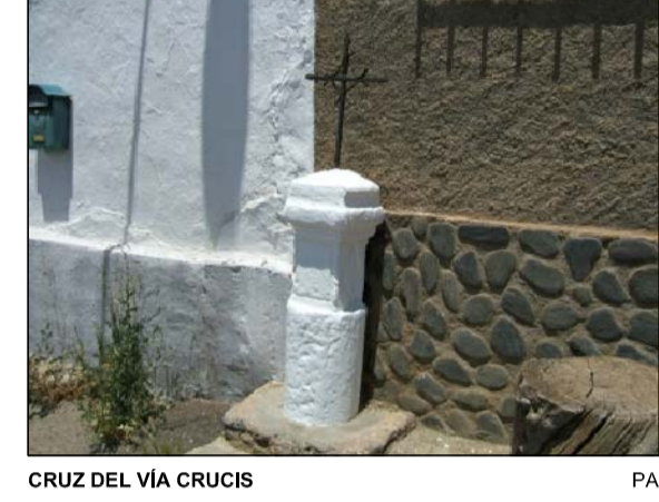
CRUZ DEL VIA CRUCIS PA