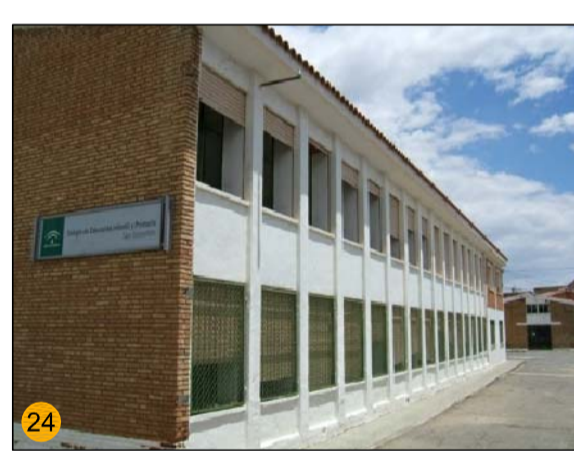
CENTRO DE EDUCACIÓN INFANTIL Y PRIMARIA "SAN SEBASTIÁN" ESCOLARIZADOS: 203 NIÑOS. UNIDADES ESCOLARES: 10 EQ-ES