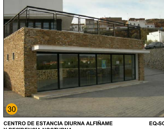
CENTRO DE ESTANCIA DIURNA ALFRAME Y RESIDENCIA NOCTURNA CAPACIDAD: 30 CAMAS EQ-SO