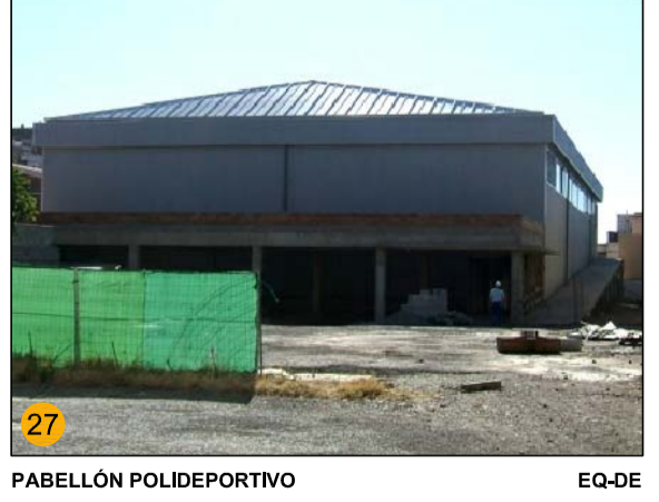
PABELLÓN POLIDEPORTIVO EQ-DE