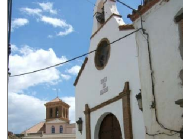
ERMITA DE SAN ANTON PA