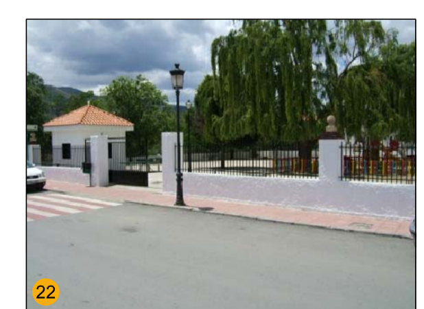
PARQUE INFANTIL ZV