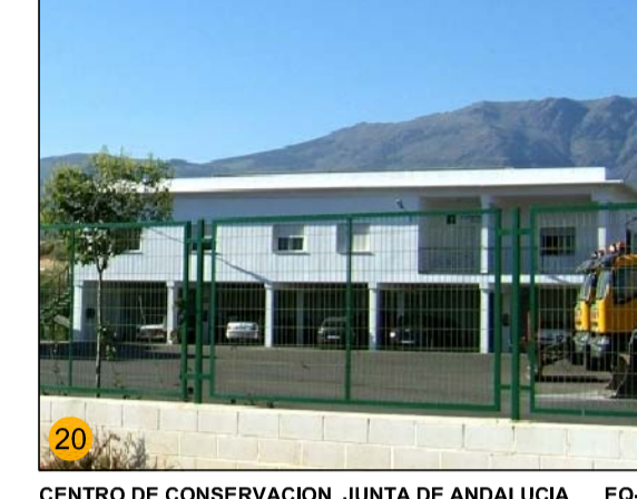
CENTRO DE CONSERVACIÓN, JUNTA DE ANDALUCÍA EQ-GE