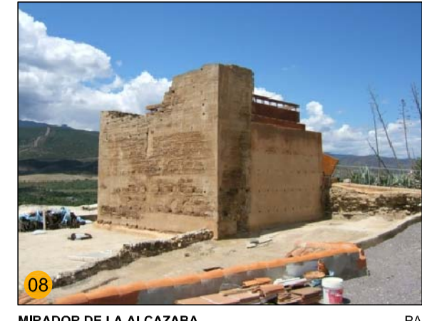
MIRADOR DE LA ALCAZABA PA