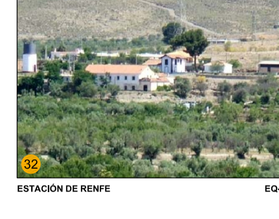
ESTACIÓN DE RENFE EQ-GE